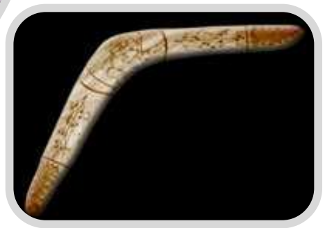
Bumerang - Australia