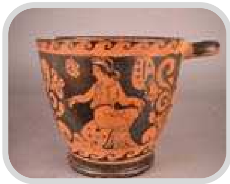
Keramik - Cina