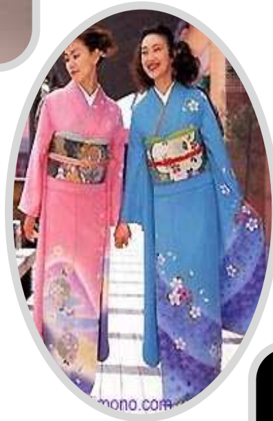
Kimono - Jepang