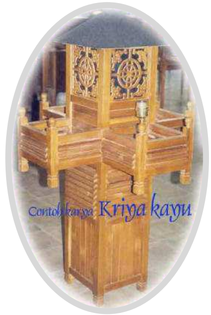
Kriya Kayu Malaysia